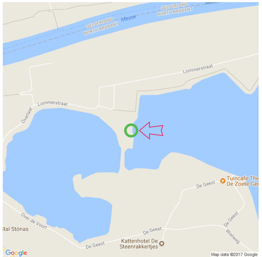
Naaktstrand Kraaijbergse Plassen (19-11-2017)