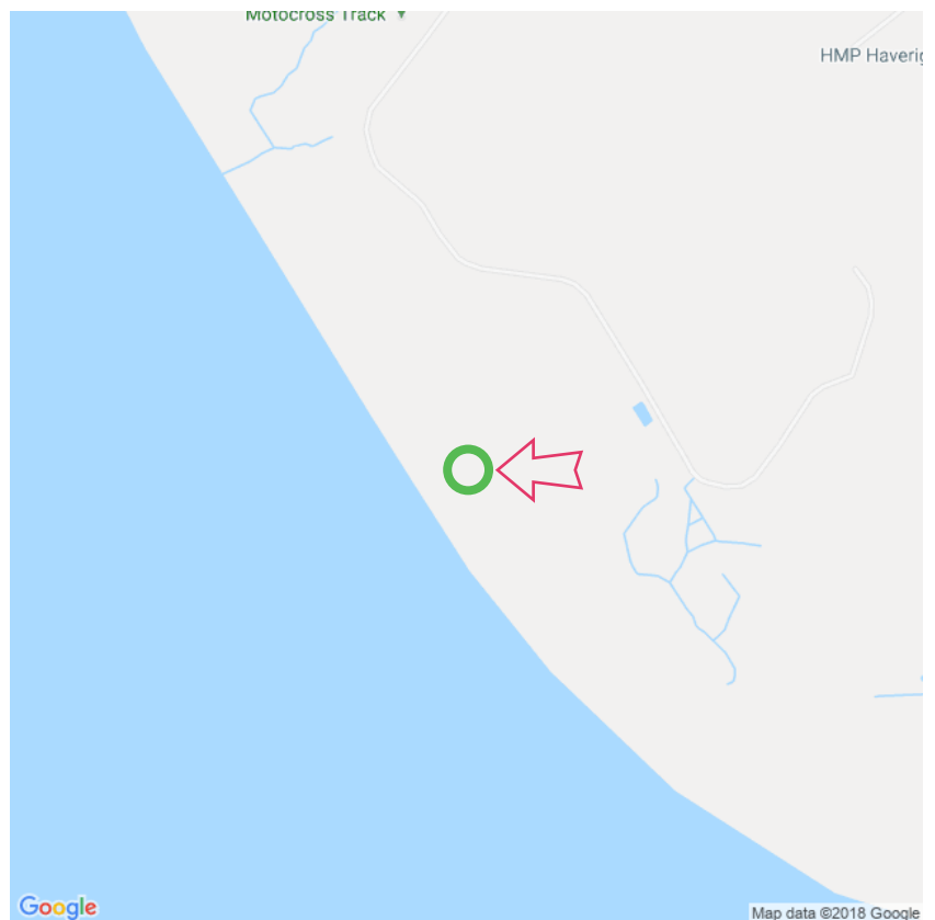
Lakeland Outdoor Club (21-08-2018)